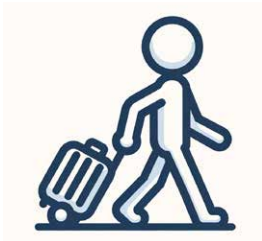
D Iemand met een trolley