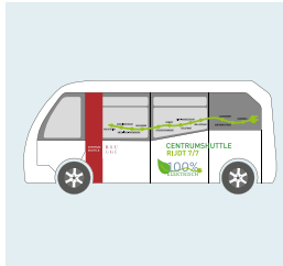
B Een centrumshuttle