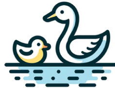
C Een dier op het water