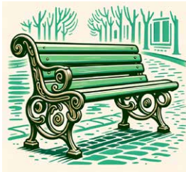
A Een zitbank