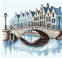
E Een brug