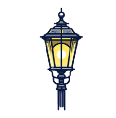
F Een lantaarnpaal