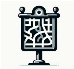
H Een stadspattegrond